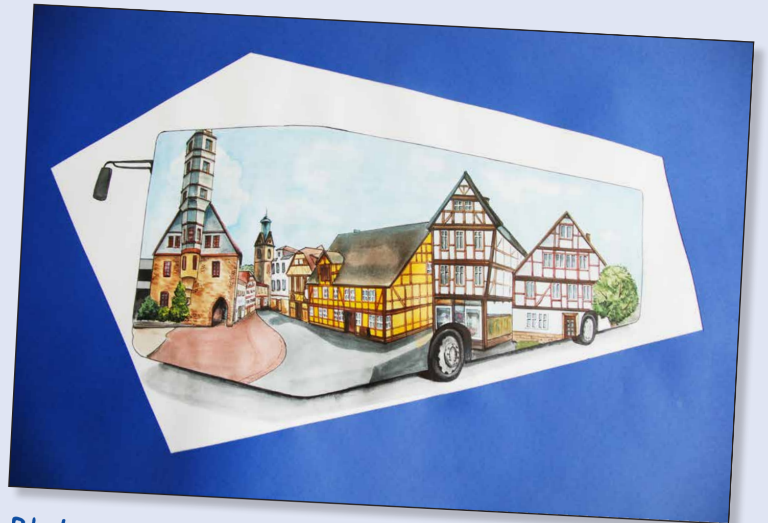
Platz 1: Frau Irina Pilz