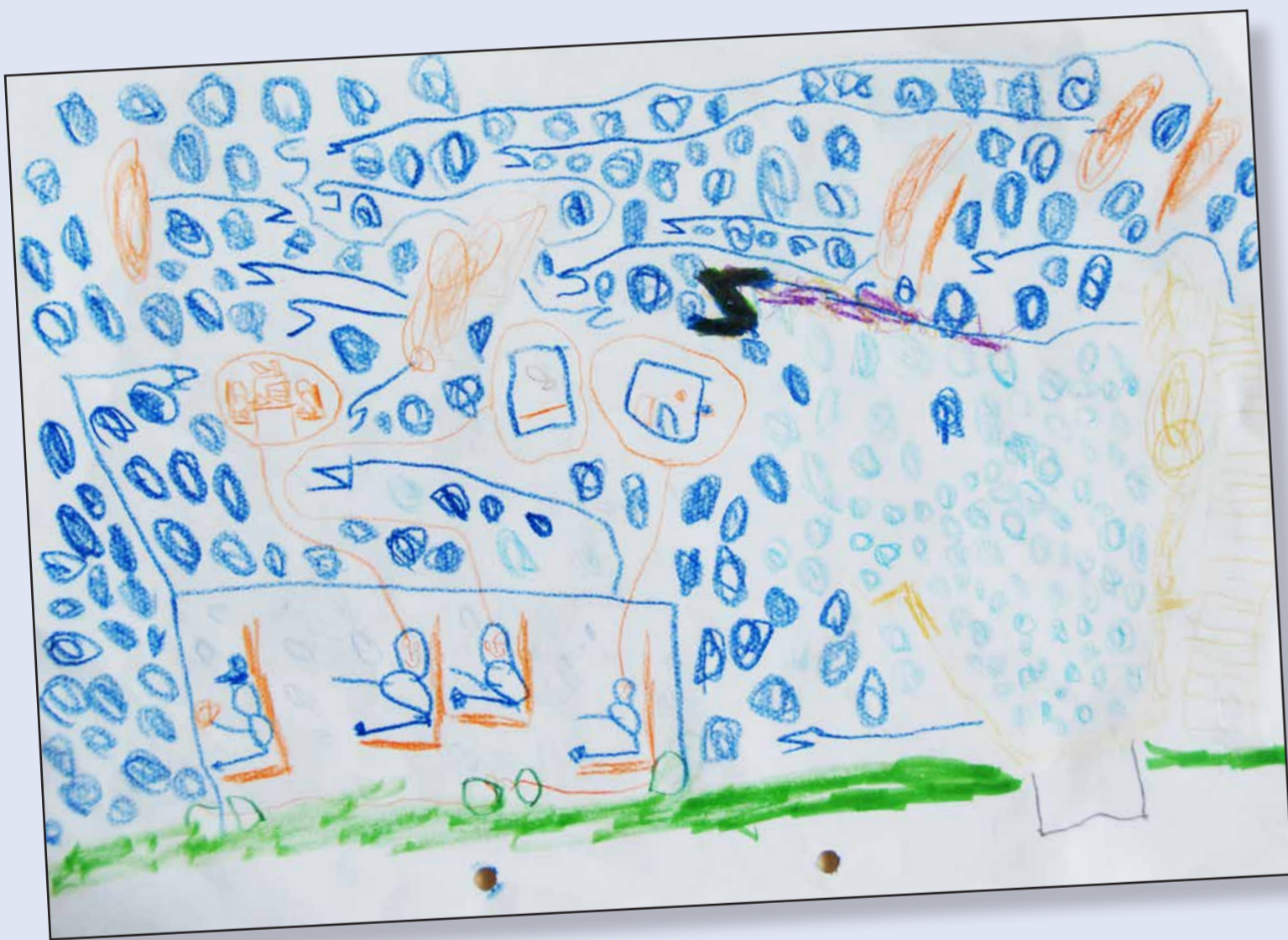
Platz 2: Luca Schmidt (5 Jahre)