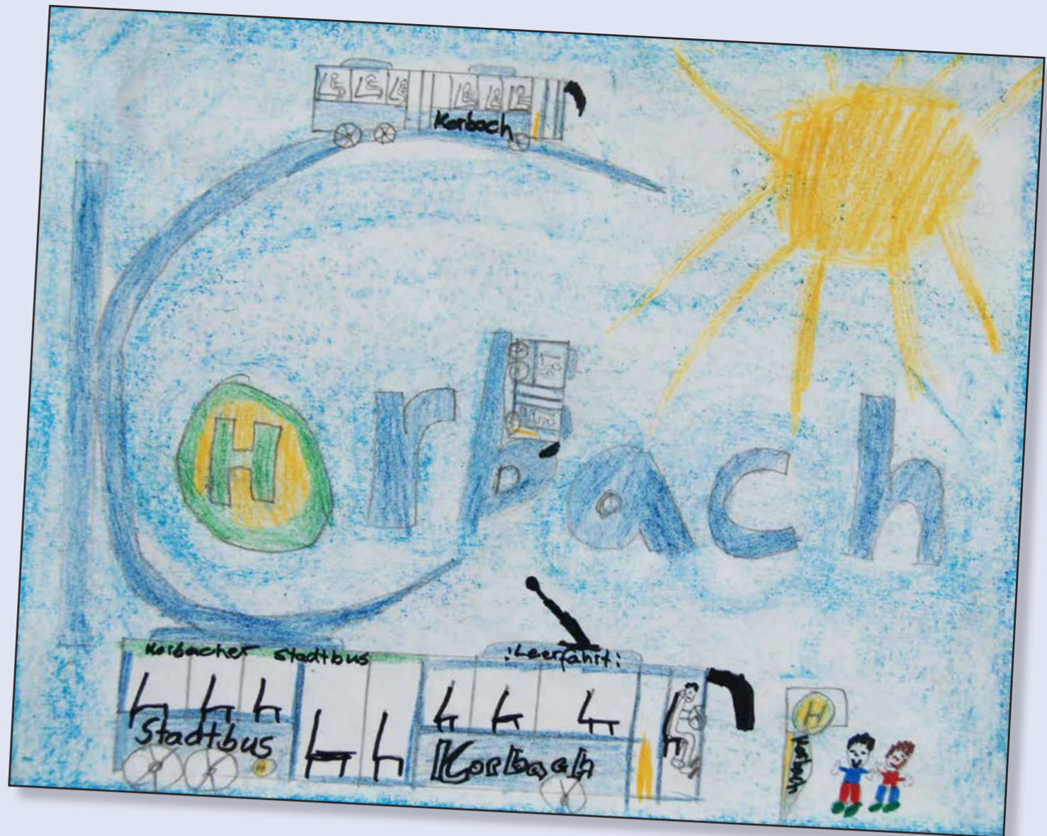
Platz 1: Fabio Schmidt (11 Jahre)