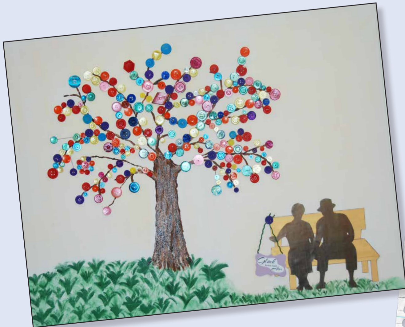
Platz 1: Bewohner und Mitarbeiter der Haus am Nordwall gGmbH, Zentrum für Pflege und Betreuung