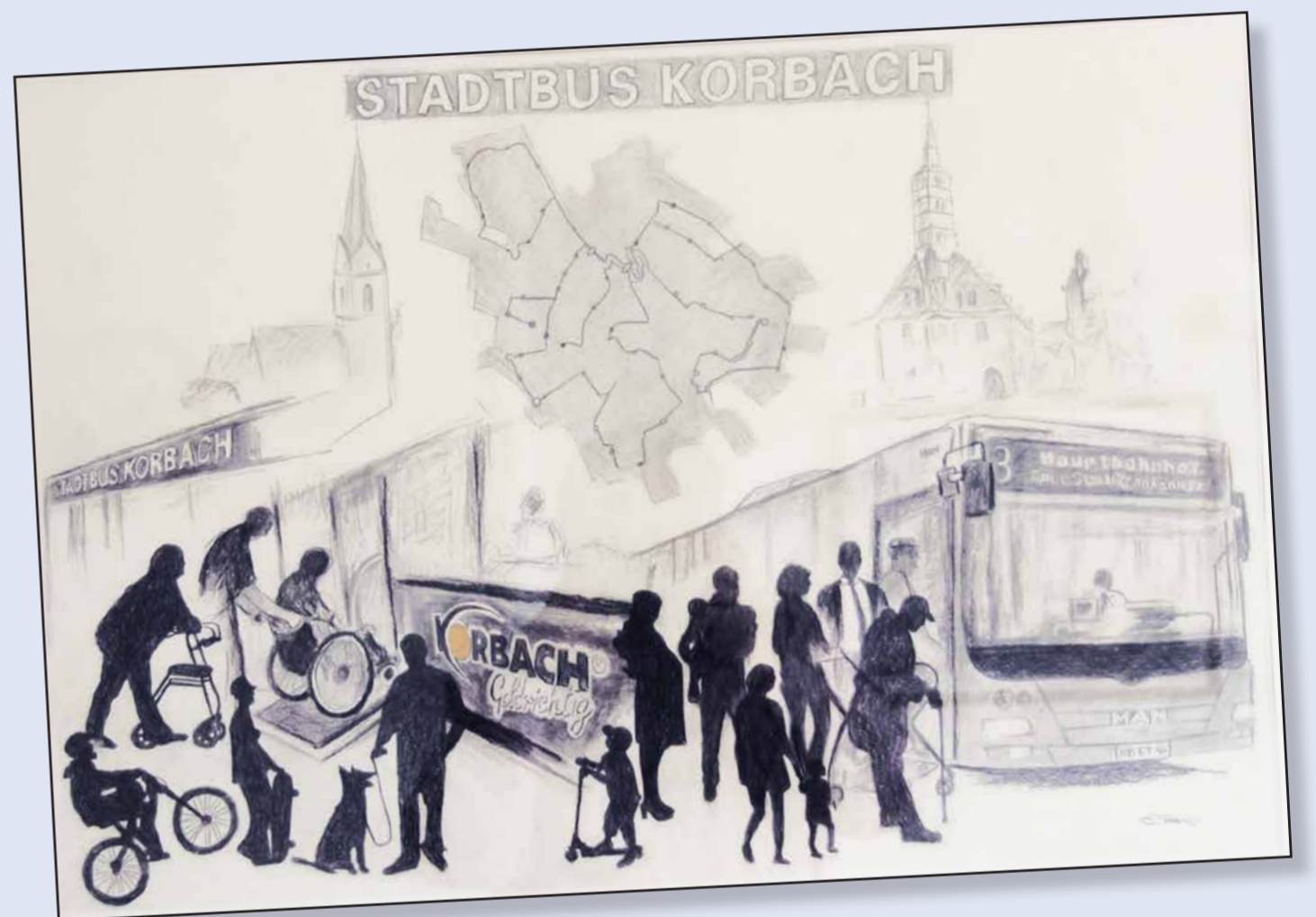
Platz 3: Herr Engin Tan