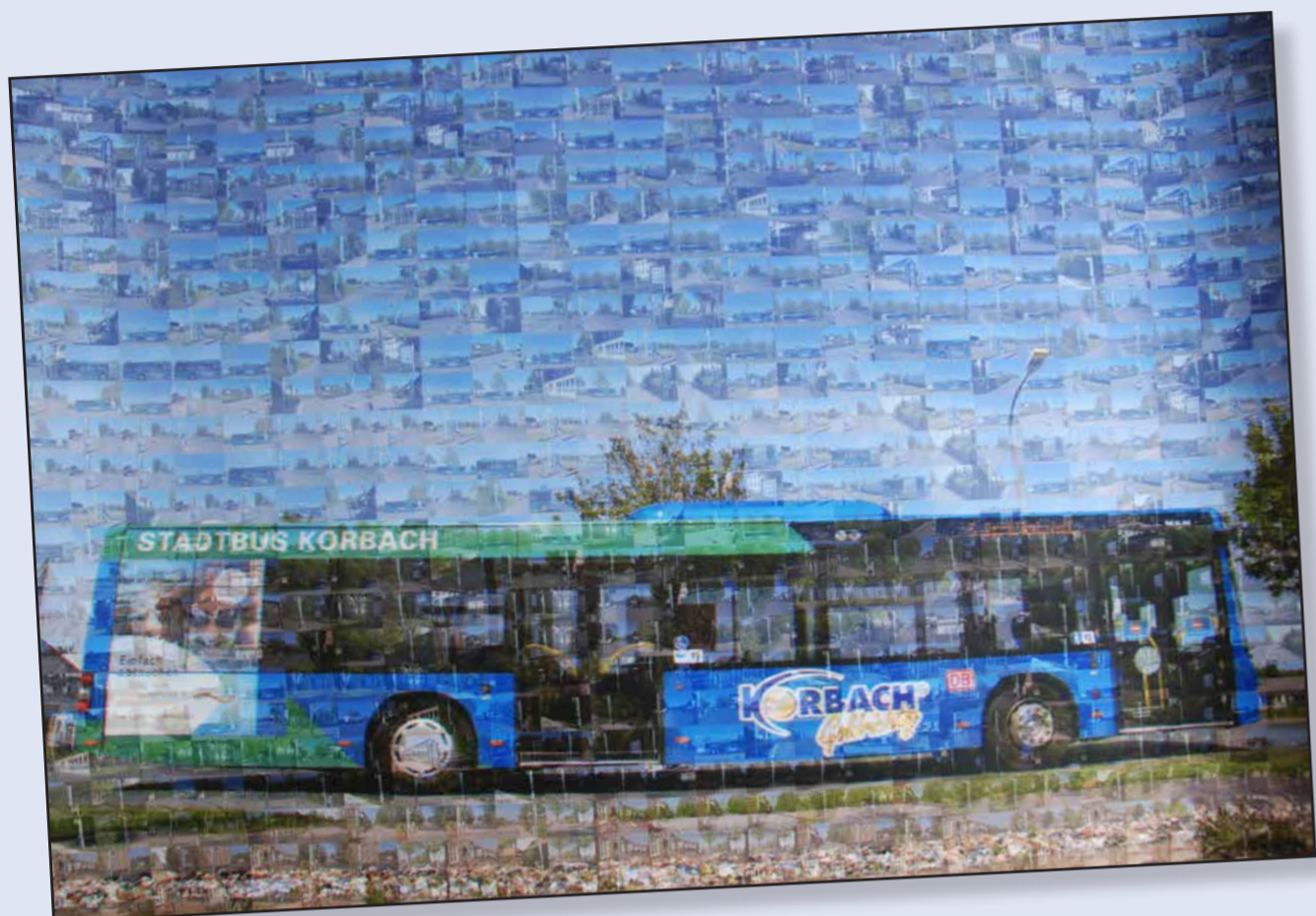
Platz 2: Herr Werner Lamm