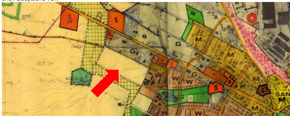
Abb. 2: Ausschnitt aus dem Flächennutzungsplan der Stadt Korbach

Der Flächennutzungsplan (FNP) der Kreis- und Hansestadt Korbach (rechtswirksam in Urfassung seit dem 31. März 1977) stellt die Gesamtfläche des Plangebietes als Fläche für die Landwirtschaft dar. Gem. § 8 Abs. 3 Satz 1 BauGB wird der FNP parallel zur Aufstellung des Bebauungsplanes Nr. 64 geändert. Die künftige Darstellung des Flächennutzungsplanes sieht die Festlegung einer Gewerblichen Baufläche vor.